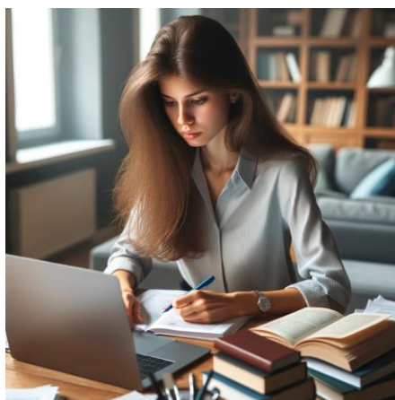
4 pav. Baigiamąjį darbą rengianti studentė

(vaizdas sukurtas pateikus užklausą „sugeneruok baigiamąjį darbą prie kompiuterio rengiančios europietiškos broužų studentės paveikslą“ OpenAI, DALL-E, 2024, https://labs.openai.com )