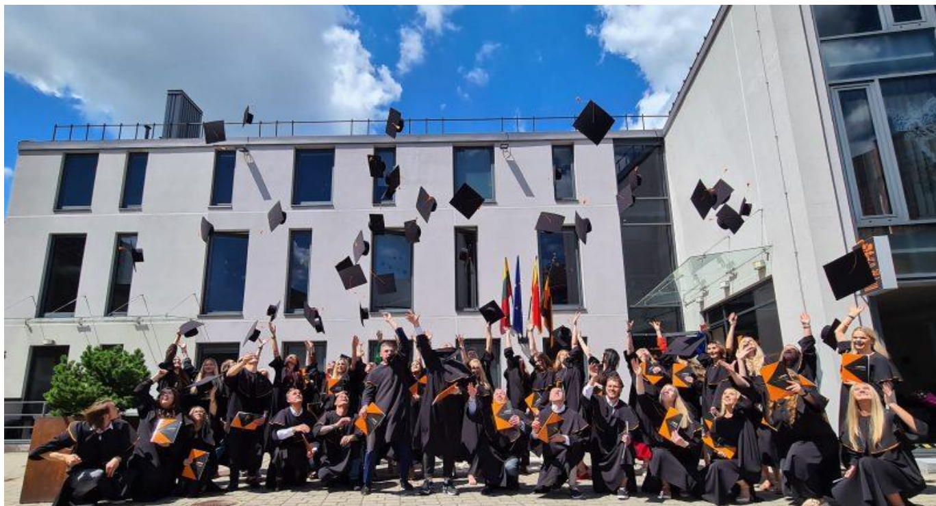
Kolpingo kolegijos absolventai 2022 m.