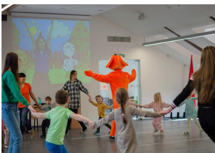
KOKSA sveikina Kolpingo darželio ugdytinius Šv. Velykų proga 2022 m. balandžio 14 d.