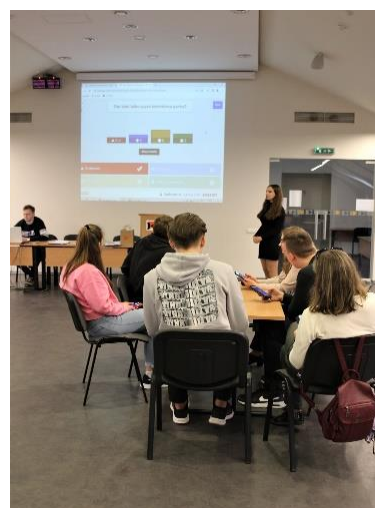
Kolpingo kolegijos studentų renginys Pasaulinei Žemės dienai paminėti 2022 m. balandžio 15 d.