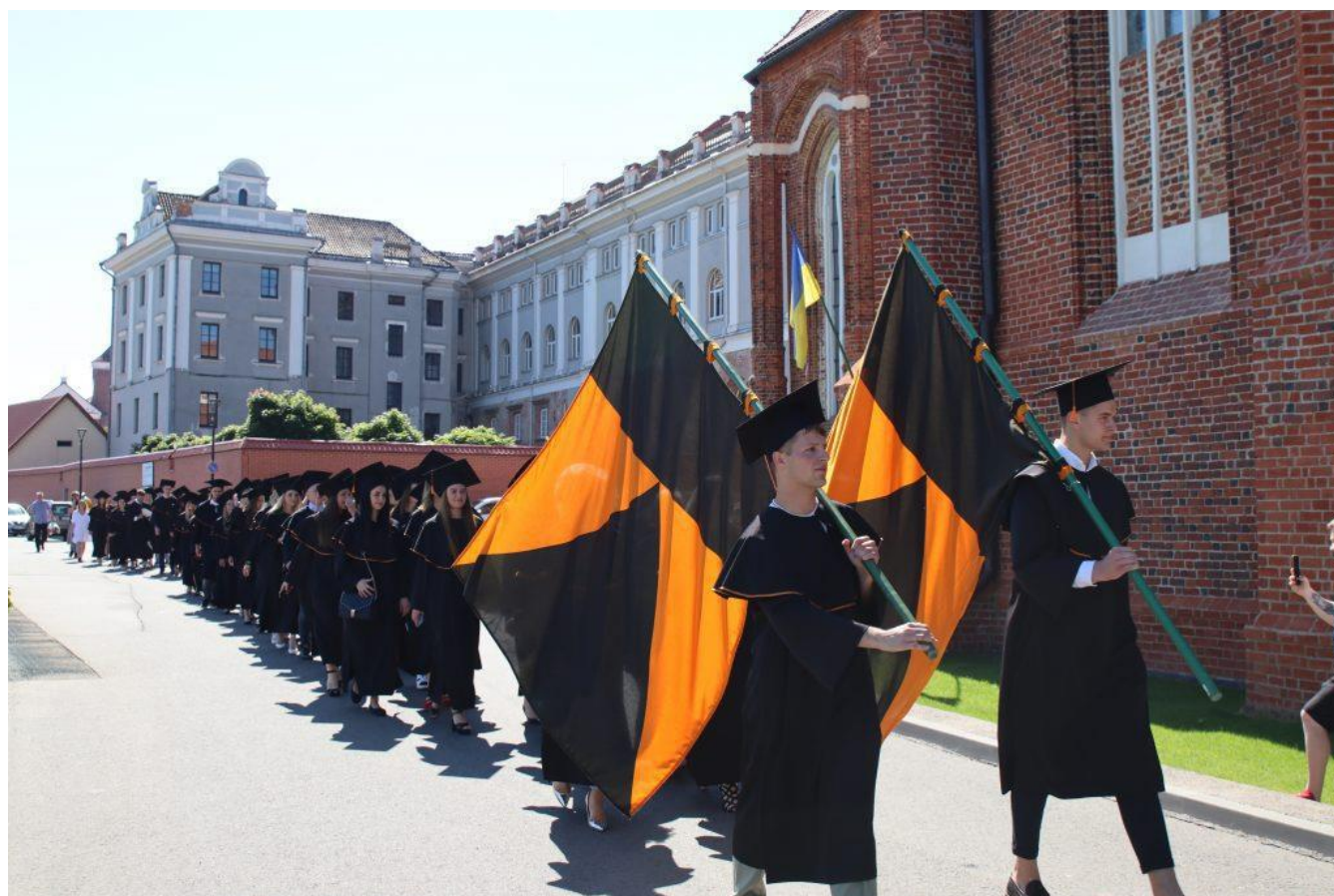
Diplomų įteikimo šventė ir iškilminga eisena 2022 m. birželio 23 d.