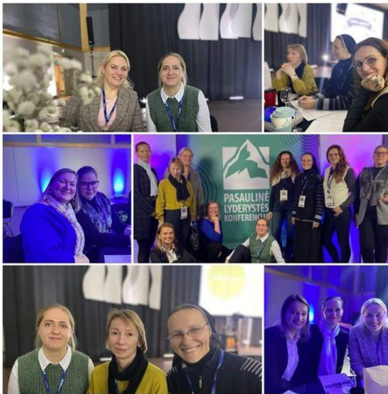
Kolpingo bendruomenės atstovai PLK Klaipėdoje 2022 m. lapkričio 11-12 d.