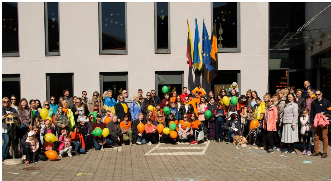
Kolpingo taikos žygis 2022 m. gegužės 7 d.