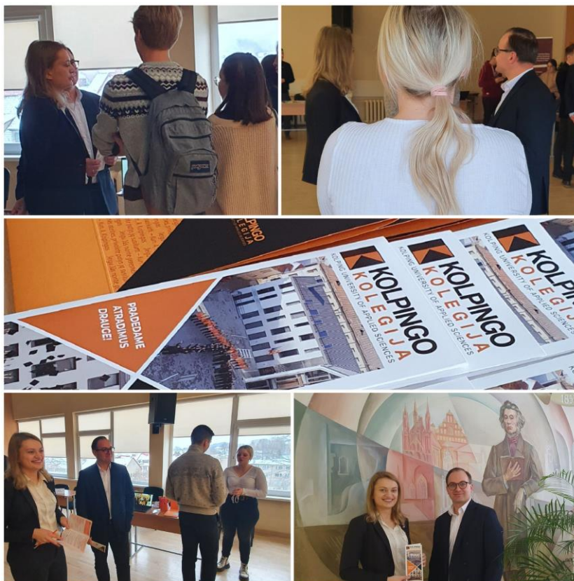
Kolpingo kolegijos atstovai karjeros dienoje Vilniaus A. Mickevičiaus licėjuje 2022 m. lapkričio 18 d.