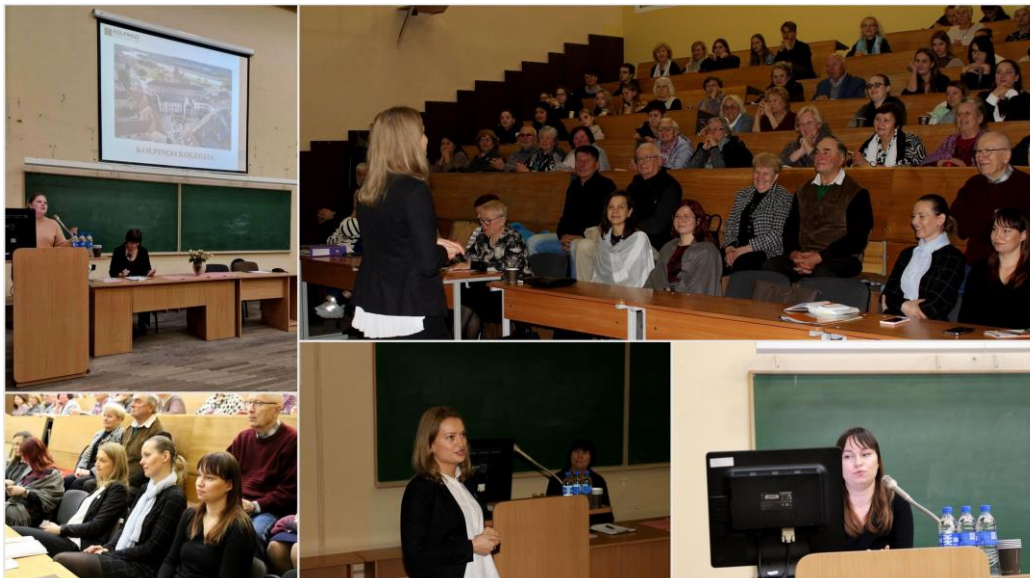
Akimirkos iš Medardo Čobuto Trečiojo amžiaus universiteto ir Kolpingo kolegijos dalyvių susitikimo Vilniuje 2022 m. spalio 26 d.